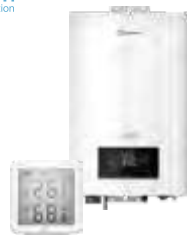
Электрические котлы и комнатные термостаты